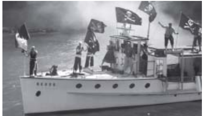
Piratenüberfall auf hoher See – «Lucerne in Motion»!

Das LCB und seine Partner sind mit dem Erfolg des zweiten «open door Luzern» äusserst zufrieden. 245 interessierte Fachleute aus Agenturen und Unternehmen haben die Gelegenheit wahrgenommen, um hinter die Kulissen der Luzern Kongresswelt zu blicken, Kontakte zu knüpfen und dabei natürlich auch Luzerner Luft zu schnuppern. Sie wurden Zeugen davon, dass sich in der Business-Stadt Luzern einiges bewegt. Die Teilnehmer konnten auf individuellen Entdeckungstouren sämtliche Kongress- und Tagungshotels sowie Lokalitäten wie etwa das Grand Casino Luzern, die SwissLifeArena und das Verkehrshaus der Schweiz kennen lernen. Dabei wurden auch Besichtigungen der eher speziellen Art geboten: Das Radisson SAS Hotel beispielsweise präsentierte seine modernsten Kongressräumlichkeiten auf einer dynamischen Schnitzeljagd. Das Hotel Cascada zeigte, dass sich auch ein Blick von aussen lohnt und liess die Teilnehmer unter der Leitung eines Bergführers gleich an der Hausfassade abseilen. Während einer Kreuzfahrt über Mittag auf dem Vierwaldstättersee bot ein als Incentive-Idee aufgemachter Piraten-Überfall Action auf hoher See! Die Organisatoren von Kongressen und Tagungen erwartet in Luzern nicht nur eine qualitativ hochstehende Kongress- und Seminarinfrastruktur, sondern auch die vielfältigsten Möglichkeiten für Rahmenprogramme in schönster Landschaft: Musik-Festivals, der Charme der Luzerner Altstadt, faszinierende Berg- oder Schiffsausflüge und vieles mehr.