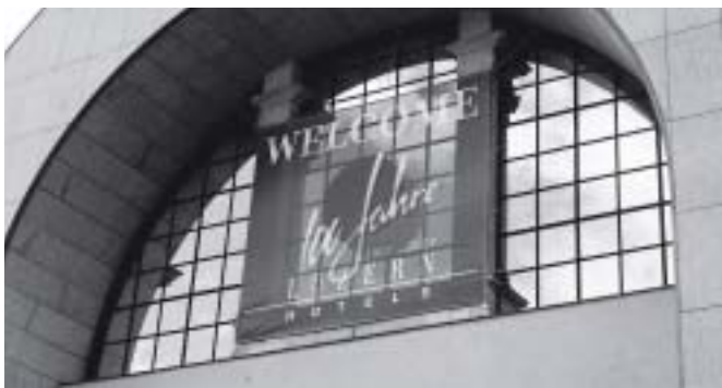
«Torbogen light» – Aufnahme vom 11. Juli 2007

Die ursprüngliche «Welcome»-Konstruktion am Torbogen beim Bahnhof Luzern hat den Gewitterböen vom 21. Juni leider nicht standgehalten (info@luzern-hotels berichtete darüber). Nach sorgfältigen Abklärungen präsentiert sich seit dem 11. Juli die sturmsichere Version der sympathischen Grussbotschaft.