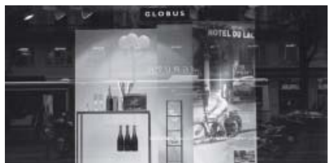
Schaufenster am 13. August 2007 um 18.06 Uhr