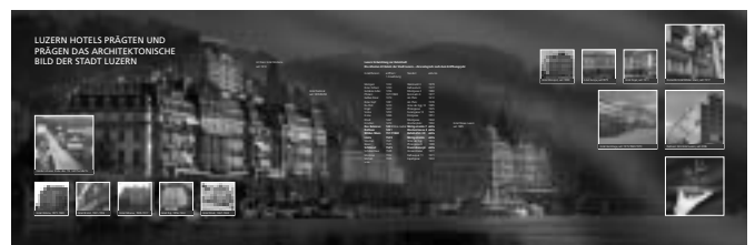
9 x 3 Meter geballte Hotellerie pro Obergeschoss