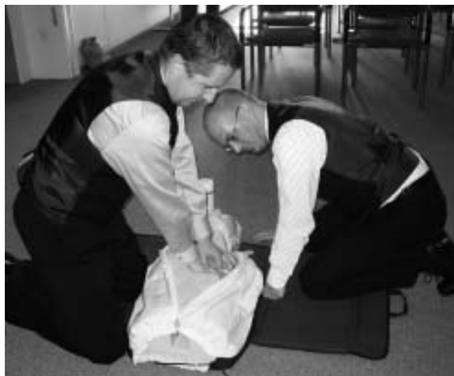
Kursteilnehmer in Aktion.

Die Mitarbeiterinnen und Mitarbeiter sollen auf mögliche Notfallsituationen bei einem Hotelgast vorbereitet sein. Darüber hinaus werden sie in der Herz-Lungen-Wiederbelebung ausgebildet und können so den Kurs nach bestandener Prüfung mit einem Ausweis nach den neusten Richtlinien abschliessen. Seit 1990 werden diese Kurse mit grossem Erfolg angeboten. Sie sind vom «Swiss Resuscitation Council» (SRC) anerkannt und werden von Fachpersonen aus den Bereichen Spital und Rettungsdienst durchgeführt. Damit ist eine äusserst praxisorientierte Ausbildung gewährleistet. In den Hotels Ramada, Swissôtel und Les Trois Rois, aber auch in zahlreichen kleineren Betrieben wurden die Kurse den Bedürfnissen der Mitarbeitenden angepasst und mit Erfolg durchgeführt.