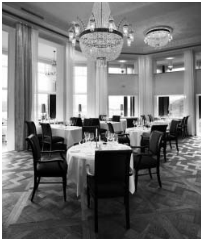
Restaurant Petit Palais.