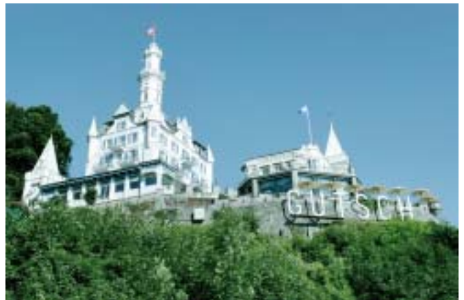
Begehrtes, zu neuem Leben erwecktes Fotosujet.